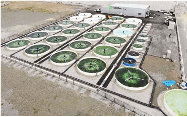
陸前高田ベースの陸上養殖場。大中小の水槽35基が5333平米の敷地に並ぶ。大水槽は直径が8mある。

2001年、東京大学大学院新領域創成科学研究科、つまり 柏キャンパスへの移転が決まったとき、透過電顕（TEM）と